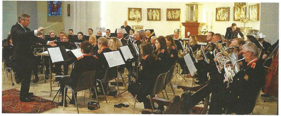
• Opluisteren mis in Petrus Bandenkerk in Heer.

Het Reünieorkest van de Limburgse Jagers bestaat 25 jaar en daarom maakt het orkest een tournee langs verschillende plaatsen. Op zondag 14 mei a.s. zijn zij te gast bij Harmonie Heer Vooruit om samen een concert te verzorgen. Dat gebeurt in het gebouw van Mercedes Benz CAC in Randwijk (Gilissendomein), waar ieder orkest een deel van het programma voor haar rekening neemt. Om 14 uur vangt het concert aan. De toegangsprijs is € 5,00 inclusief een consumptie en kaarten zijn verkrijgbaar via info@vriendenheer Vooruit.nl of op dinsdagavond tijdens de repetities in Aen de Wan in Heer.